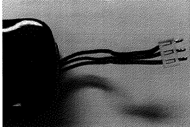
Fig. 3 – Fiação com conector do pack de bateria