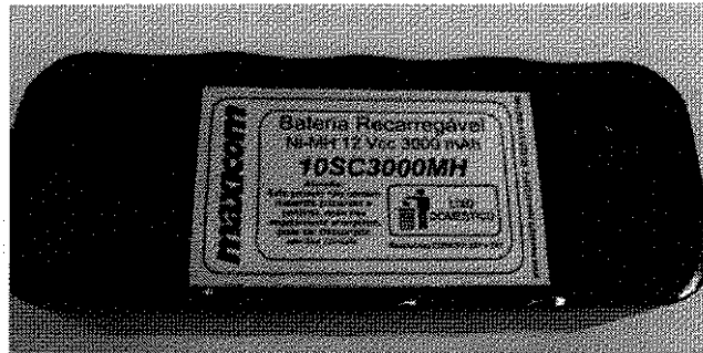
Fig. 1 – Visão superior do pack de bateria