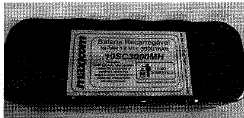
Fig. 1 – Visão superior do pack de bateria